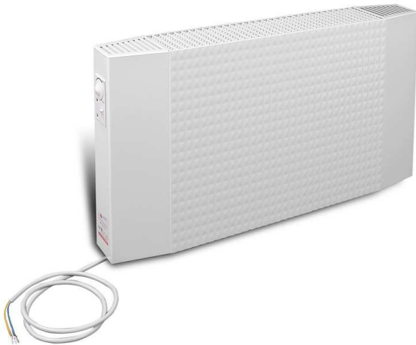
STACJONARNE mocowanie naścienne